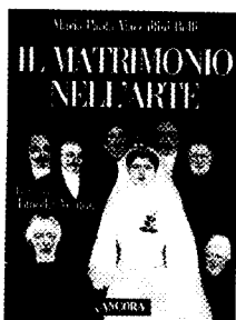
MARIA PAOLA MACCALLINI BELLI Il matrimonio nell'arte Ancora Editrice, 2005 pp. 234, Euro 36,00

Gregiamente illustrato, il volume che l'Ancora di Milano ha dato alle stampe tratta un tema chiave della cultura cristiana: il rapporto tra l'uomo e la donna, solennemente consacrato dal matrimonio, attraverso diciassette opere di pittura eseguite tra il XIV e il XX secolo. Così come nella realtà, la scansione del volume prevede tre momenti: la cerimonia nuziale, i cortei e il banchetto di nozze e la vita insieme. Tra le opere che fanno da sfondo alla catechesi Lo sposalizio della Vergine di Taddeo Gaddi (1328) e di Raffaello (1504), L'educazione e sposalizio dei trovatelli di Domenico Di Bartolo (XV secolo), la Pala dei sette sacramenti di Rogier van der Weyden (1448), il Matrimonio di Caterina de' Medici ed Enrico II di Giorgio Vasari (1533), le Nozze in campagna di Henri Rousseau (1904), il Corteo nuziale di Maria di Giotto (1304) e altre opere di Giovanni di Ser Giovanni, del Veronese, di Pieter Bruegel, di Jan Van Eyck, di Lorenzo Lotto.