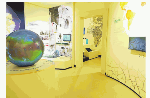
Il Museo della Geografia a Padova: anche qui ci saranno visite guidate

Per la parte relativa agli spettacoli si comincia con "Alla scoperta dell'Universo tra scienza, musica e astronomia", un viaggio nel mito e nella scienza proposto da Melody on Time, per passare poi al divertente "Il metodo