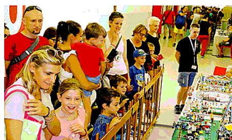
Una delle precedenti edizioni della manifestazione

Anche in questa occasione, la mostra si ubicherà a ridosso della pausa estiva, per quanto riguarda le attività universitarie: le opere saranno infatti esposte nei giorni 30 e 31 luglio, affiancate da iniziative varie. Più di 4.000