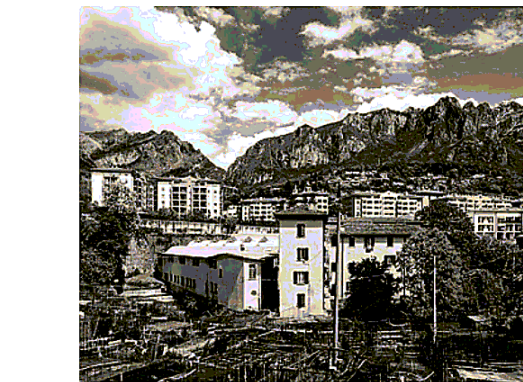
Una delle fotografie in mostra