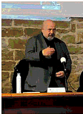
BARLETTA Il professor Franco Cardini