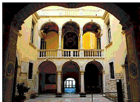
BARLETTA L'atrio di Palazzo Della Marra