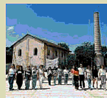
XLART L'area ex distilleria