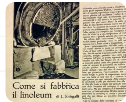
Come si fabbrica il linoleum di L. Sinigalli